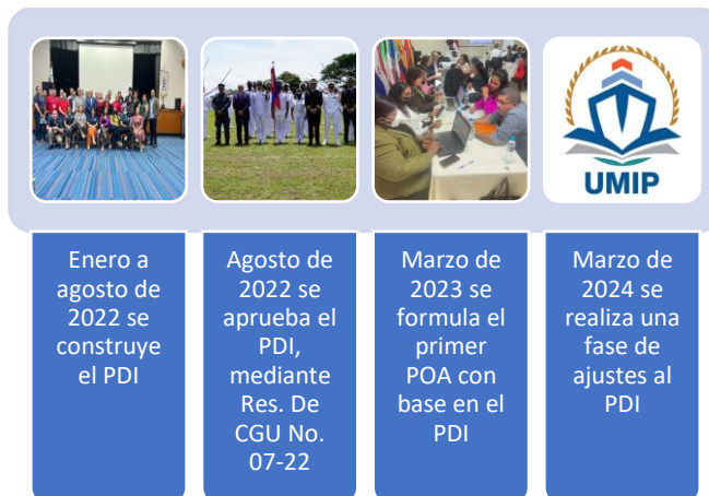
Gestión del Plan de Desarrollo Institucional

alcanzó su fase operativa con la formulación del POA 2024, el cual fue formulado en el primer trimestre del año 2023.