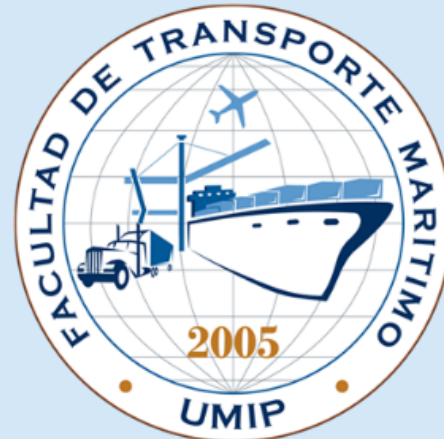
Facultad de Transporte Marítimo